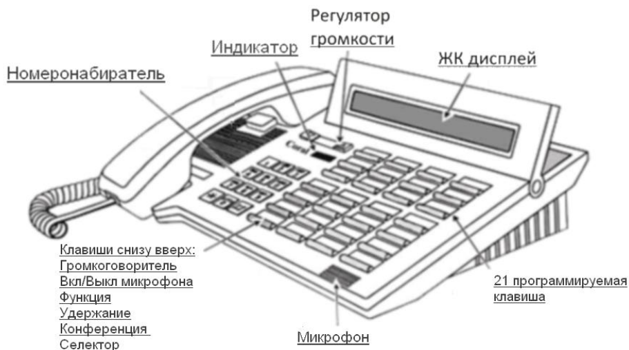
Рисунок 3 – Расположение элементов управления системного телефонного аппарата серии DKT-R2321

Терминал имеет следующие элементы управления и индикации: