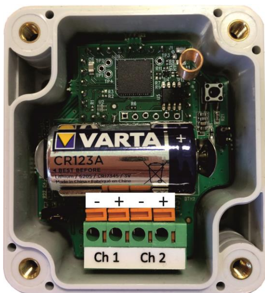
Рисунок 4 – Нумерация контактов SZ-W02

4.1 Для подключения по схеме геркона (релейная схема) установить перемычку JP2 соединив средний контакт и контакт около конденсатора С6. К зеленой колодке подключить шлейф к каналам ch1 и ch2: нажать на оранжевый фиксатор шлицевой отверткой, вставить зачищенный конец провода шлейфа до упора и отпустите фиксатор.