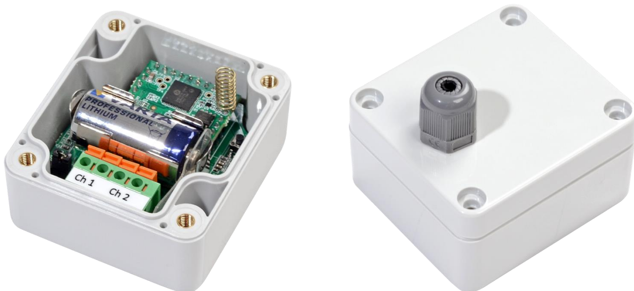
Рисунок 1 – Внешний вид SZ-W02

Регистратор SZ-W02 представляет собой микропроцессорный прибор, выполненный в пластмассовом корпусе, защищенном от воздействия внешней среды, состоящим из основной платы и платы субмодуля. На основной плате располагаются источник питания, счетные входы, световая индикация и кнопка управления. На субмодуле расположены микроконтроллер, энергозависимая память и приемопередающая антенна. Внешний вид регистратора импульсов приведен на рисунке .