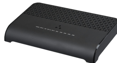
RG-5520G-Wax rev.B/RG-5520G-Wax-Z rev.B

RG-5520G-Wax/Wax-Z — двухдиапазонный Wi-Fi роутер с гигабитными портами LAN Ethernet и 2.5 гигабитным портом WAN Ethernet с мощным двухъядерным процессором. Устройство поддерживает стандарт 802.11ax, который работает одновременно с двумя потоками, обеспечивая скорость до 1.201 Гбит/с на диапазоне 5 ГГц. Использование технологии MU MIMO позволяет сделать устройство универсальным решением для организации корпоративных сетей.