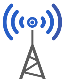
Абонентская станция WB-3P-LR5